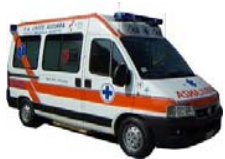
Pronto intervento sanitario