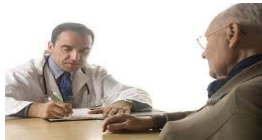
Medici di base e specialisti