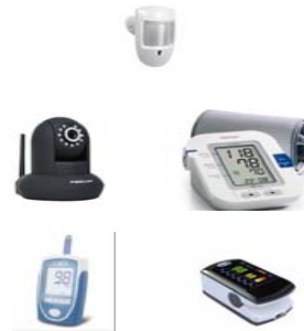
Unità controllo locale